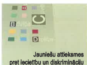
JAUNIEŠU ATTIEKSMES PRET IECIETĪBU UN DISKRIMINĀCIJU KOPSAVILKUMS

Kalendārā apkopota skolu pieredze iecietību veicinošu aktivitāšu organizēšanā, metodiskie ieteikumi jauniešu cilvēktiesību kompetences paaugstināšanai un būtiskākais cilvēktiesību tēmā un mācību stratēģijās.